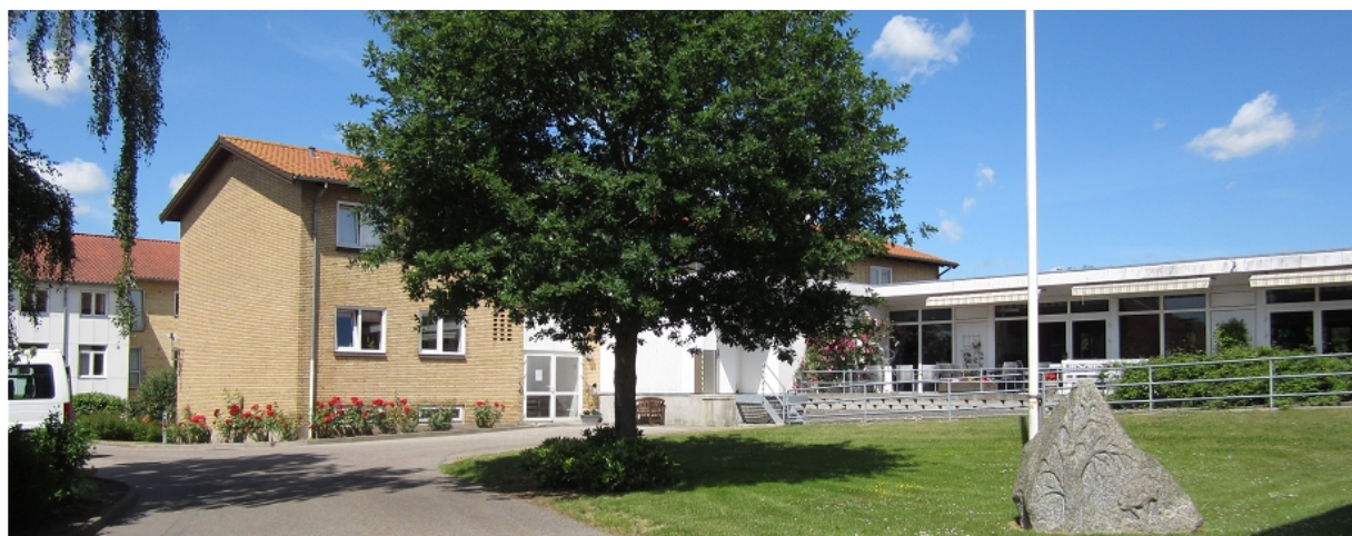
Plejecenter Farsøhthus, Allingåbro

Ældrerådet har desuden et tæt samarbejde med politikere og forvaltning. Det er altid let at få kontakt, når der er behov.