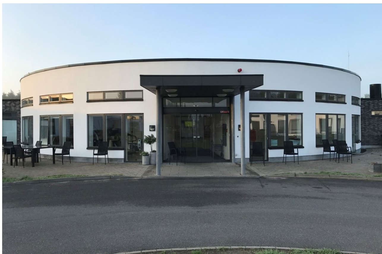
Glesborg Plejecenter, Glesborg

Ældrerådet udarbejder altid konstruktive høringssvar, når der meldes besparelser.