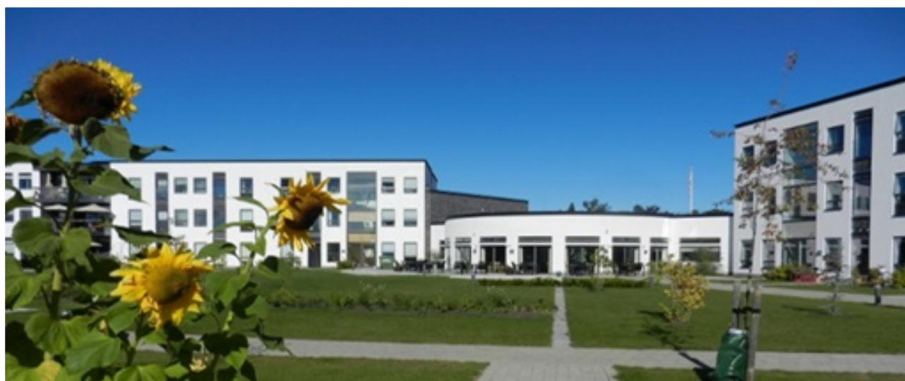
Plejecenter Violskrænten, Grenaa

Ældrerådet har her samarbejdet med Handicaprådet.