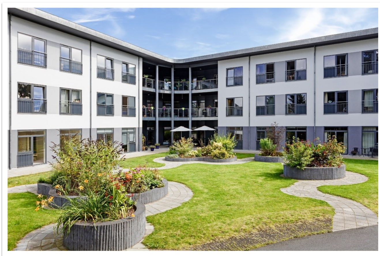
Plejecenter Digterparken, Grenaa

Dette uddybes nærmere under fokusområder.