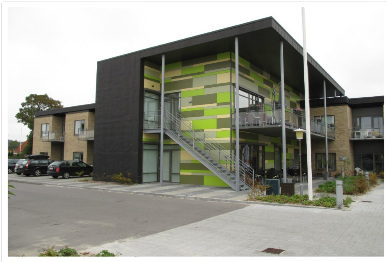
Plejecenter Møllehjemmet, Auning

Ældrerådet afventer spændt den videre udvikling.