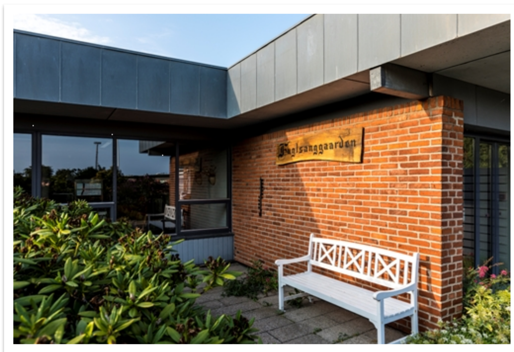
Plejecenter Fuglsanggården, Grenaa

Ældrerådet har ved dialogmøderne anbefalet små teams i hjemmeplejen. Der er nu igangsat forsøgsordning i hjemmeplejen i Glesborg.